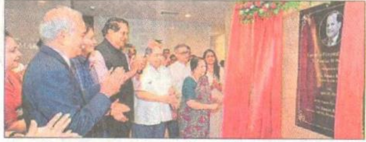
ಡಾ.ರಾಮದಾಸ್ ಎಂ.ಪೈ ಬ್ಲಾಕ್ ಉದ್ಘಾಟಿಸಲಾಯಿತು

ಕಸ್ತೂರ್ಬಾ ಆಸ್ಪತ್ರೆ ಆವರಣದಲ್ಲಿ ಹೊಸದಾಗಿ ನಿರ್ಮಿಸಲಾದ ಡಾ. ರಾಮದಾಸ್ ಎಂ.ಪೈ ಬ್ಲಾಕ್ ಅತ್ಯಾಧುನಿಕ ಸೌಲಭ್ಯ ಹೊಂದಿದ್ದು ರೋಗಿಗಳಿಗೆ