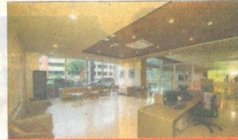
ಆತ್ಮಾಧುನಿಕ ಸೌಲಭ್ಯಗಳನ್ನು ಒಳಗೊಂಡ ನೂತನ ಬ್ಲಾಕ್

ಇಡೀ ಬ್ಲಾಕ್ ಸಂಪೂರ್ಣ ಕೇಂದ್ರೀಕೃತ ಹವಾನಿಯಂತ್ರಣದಿಂದ ಕೂಡಿದೆ. ಹೊಸ ಬ್ಲಾಕ್ ತಳ ಅಂತಸ್ತು ಮತ್ತು ಐದು ಮಹಡಿಗಳನ್ನು ಒಳಗೊಂಡಿದೆ. ವಿದೇಶಿ ರೋಗಿಗಳಿಗೆ ಒಂದೇ ಕಡೆ ವೈದ್ಯಕೀಯ ಮತ್ತು ಆಡಳಿತಾತ್ಮಕ ಸೌಲಭ್ಯಗಳನ್ನು ಪಡೆಯಲು ಅನುವು ಮಾಡಿಕೊಡುವ, ವಿಶೇಷವಾದ ಅಂತಾರಾಷ್ಟ್ರೀಯ ರೋಗಿಗಳ ಲಾಂಚ್‌ನೊಂದಿಗೆ ಅಂತಾರಾಷ್ಟ್ರೀಯ ರೋಗಿಗಳಿಗೆ ಚಿಕಿತ್ಸಾ ಕ್ರಮ ಪೂರೈಸುವ ಸೌಲಭ್ಯಗಳನ್ನು ಹೊಸ ಬ್ಲಾಕ್ ಹೊಂದಿದೆ.