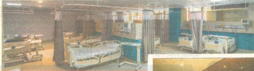
ದೇ ಕೇರ್ ಸೆಂಟರ್‌ನ ಒಂದು ದೃಶ್ಯ