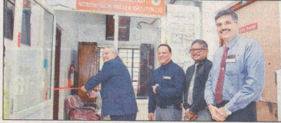
ನೇತ್ರ ಮೈಕ್ರೋಸರ್ಜಿಕಲ್ ಕೌಶಲ್ಯ ಮತ್ತು ಸಿಮ್ಯುಲೇಶನ್ ಲ್ಯಾಬ್‌ನ ಉದ್ಘಾಟನೆ ಮಂಗಳವಾರ ನಡೆಯಿತು.