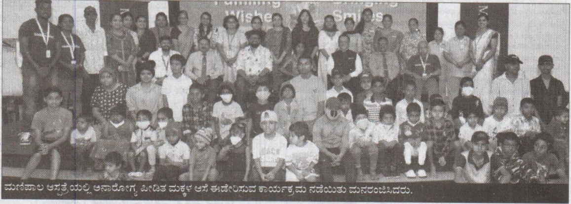
ಮಣಿಪಾಲ ಆಸ್ಪತ್ರೆಯಲ್ಲಿ ಅನಾರೋಗ್ಯ ಪೀಡಿತ ಮಕ್ಕಳ ಆಸೆ ಈಡೇರಿಸುವ ಕಾರ್ಯಕ್ರಮ ನಡೆಯಿತು ಮನರಂಜಿಸಿದರು.